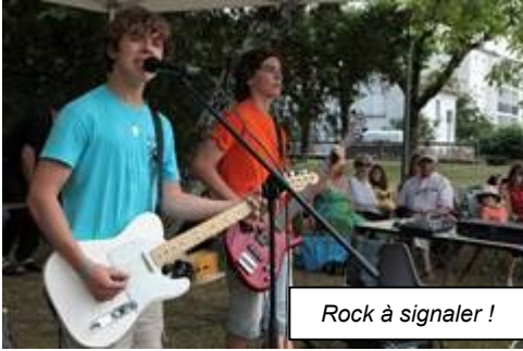
Rock à signaler !