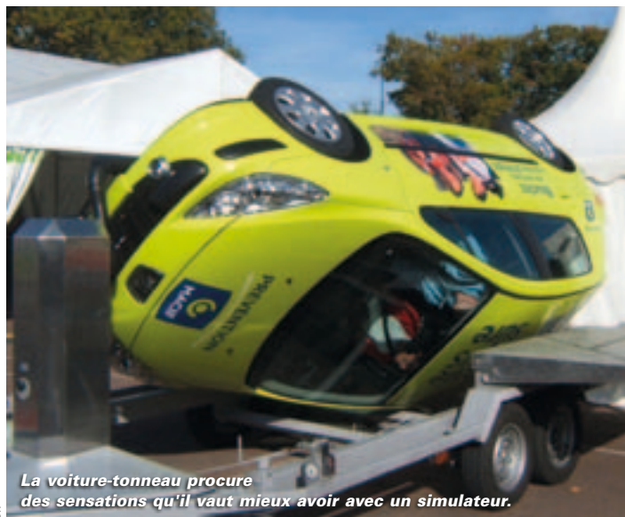
La voiture-tonneau procure des sensations qu'il vaut mieux avoir avec un simulateur.

forts marqueront l'après-midi. Un cascadeur reproduira deux accidents : entre voitures puis entre une voiture et un cyclo. Les pompiers interviendront comme en vrai sur les lieux du sinistre... Ça risque d'être impressionnant et de faire réfléchir. Ensuite, trois courts-