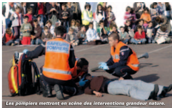
Les pompiers mettront en scène des interventions grandeur nature.

Néanmoins, la journée au stade de Pissardant concernera tout le monde ! Le programme est conçu pour marquer les esprits. En plus des stands d'information, des jeux, des simulateurs... présents toute la journée sous tivolis, deux moments