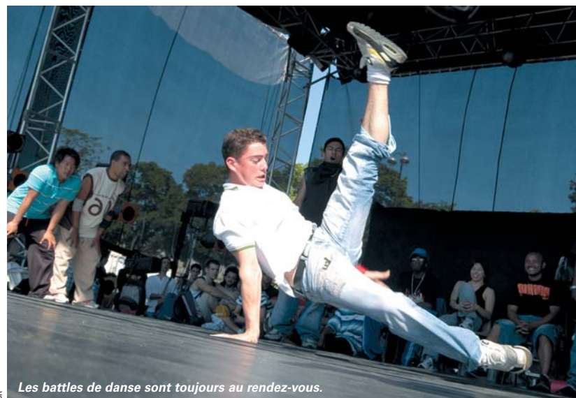
Les battles de danse sont toujours au rendez-vous.