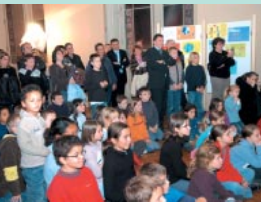
Niort fêtera le 18 novembre le 3 e anniversaire du label "Ville amie des enfants".