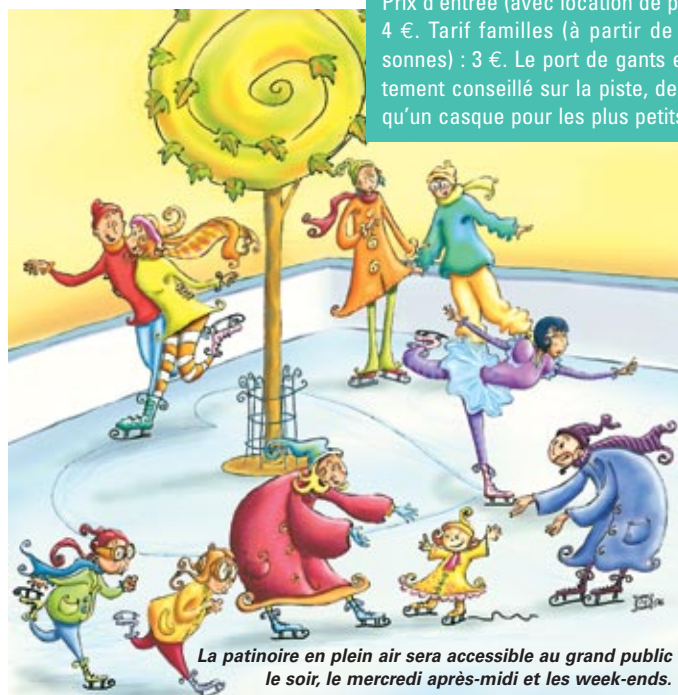
La patinoire en plein air sera accessible au grand public le soir, le mercredi après-midi et les week-ends.

la ville avec des animations régulières. L'objectif : que ça bouge sur la glace sans interruption ! Car durant ces deux mois, la patinoire en plein air sera ouverte sur un large créneau horaire, de 9h le matin à 22h le soir. Le matin et en début d'après-midi, la patinoire sera destinée aux scolaires qui pourront venir à pied. Plus qu'un