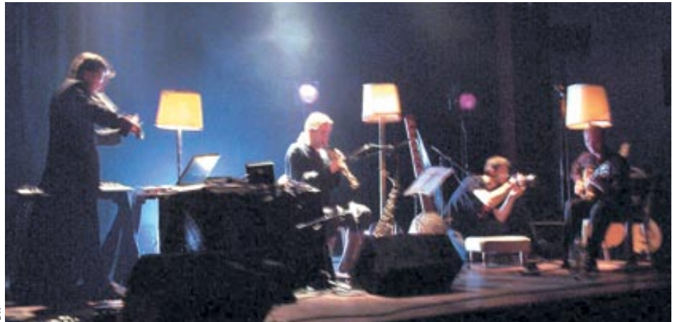
Welcome ouvre la porte aux computers sur la scène du Camji le 6 mai.

puisse les utiliser en temps réel sur scène", explique le guitariste qui voue également ses doigts à la kora.