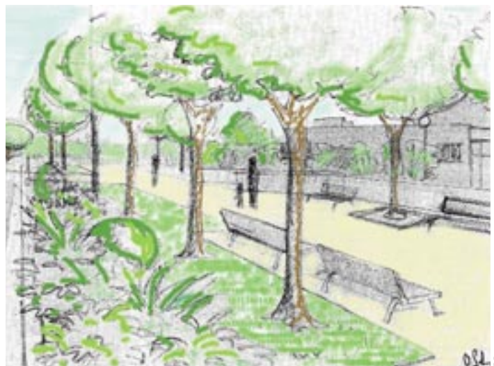
Un grand mail planté d'arbres permettra d'accéder aux différents équipements des Brizeaux.

De nombreux écoliers utilisent ce raccourci pour se rendre au groupe scolaire Langevin-Wallon. D'où la nécessaire mise en sécurité des accès donnant sur les chaussées (rues Mirabeau et Saint-Just), avec la mise en place de chicanes à chaque débouché. Enfin, la mise en valeur esthétique passe par l'organisation d'allées et d'espaces aux fonctionnalités différentes, avec une palette végétale créée autour de fleurs et de grands massifs persistants. Le tout pour un