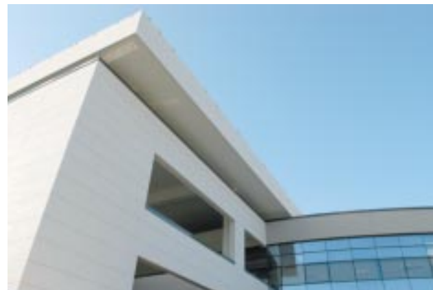
Le nouveau bâtiment occupe 6 500 mètres carrés soit trois fois les anciennes urgences.

grande nouveauté est aussi l'intégration des urgences pédiatriques. "Jusqu'à présent, les familles qui accompagnaient un enfant hésitaient entre les urgences et le service Pédiatrie. Nous avons donc prévu une section spécifique pour les urgences concernant les enfants au sein même des urgences."