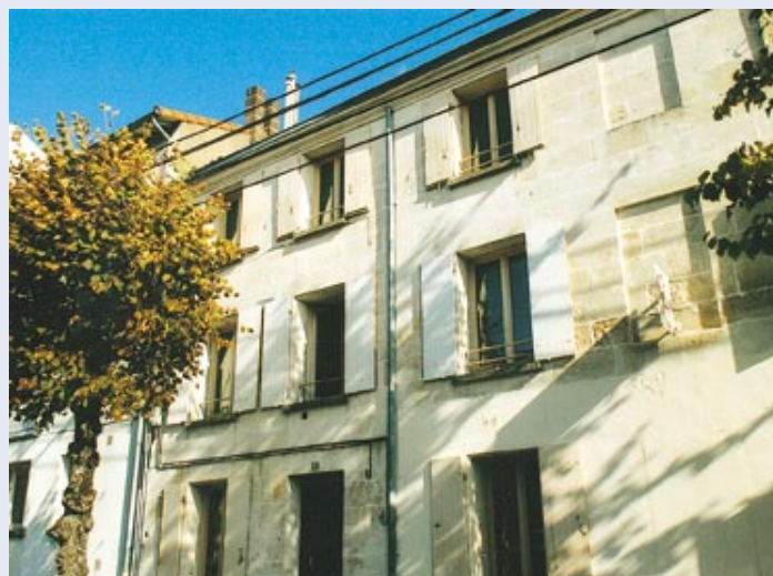
Le foyer d'accueil d'urgence a ouvert ses portes au 105 de l'avenue Saint-Jean-d'Angély.

En ces temps où notre société laisse de plus en plus d'exclus au bord de la route, l'existence d'un foyer d'accueil d'urgence s'affirme comme indispensable. Mais personne n'en veut près de chez lui. Longtemps, ce sujet alimente les débats du Conseil de