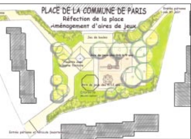
Les enfants disposeront de trois aires de jeux adaptés à leurs âges.