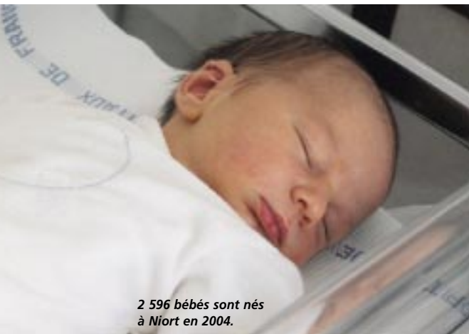
2 596 bébés sont nés à Niort en 2004.