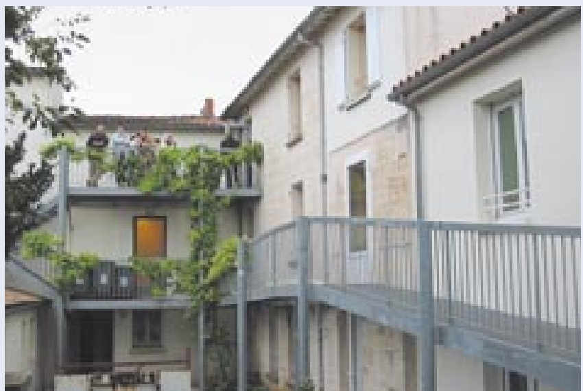
Les membres du Conseil de quartier ont apprécié de pouvoir visiter le foyer avant son ouverture.

local de la rue du Chaudronnier. Impérativement proche à la fois de l'hôpital et de la gare, son installation fut un temps pressentie rue de l'Yser, où les habitants l'avaient refusée.