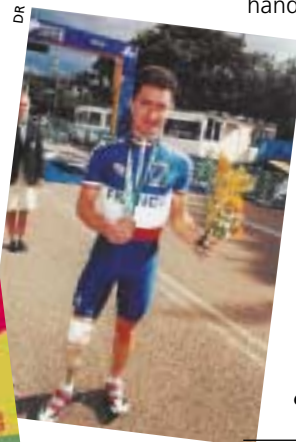
Le 4 avril, la course du Lions club de la Venise verte, parrainée par le médaillé paralympique Sébastien Bichon.

Inscriptions : 5 euros pour les adultes, gratuit pour les enfants. Contact : M. Beaufills, 05 49 24 13 23 ou 06 64 17 20 10.