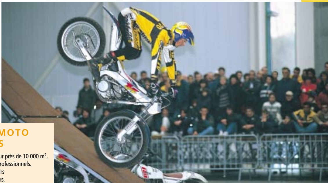
A côté du traditionnel spectacle d'acrobaties, le dessinateur Nicolaz, qui officie notamment à Moto mag, sera lui aussi cette année au rendez-vous des Pucés moto.