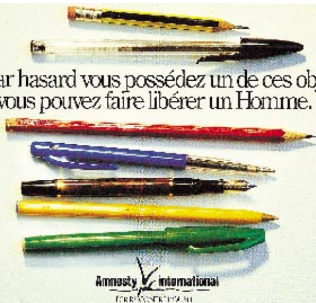
Le groupe niortais d'Amnesty existe depuis 1976.

Si par hasard vous possédez un de ces objets, vous pouvez faire libérer un Homme.