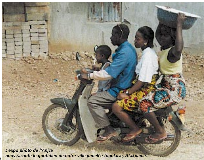
L'expo photo de l'Anjca nous raconte le quotidien de notre ville jumelée togolaise, Atakpamé.

Carrefour des métiers de bouche Poitou-Charentes, à Noron du 15 au 19 novembre de 10 à 19 h (du samedi 14 h au mercredi 17 h). Entrée gratuite pour tous publics.