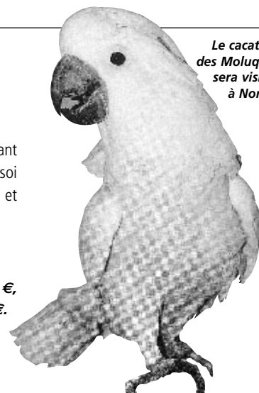
Le cacatoès des Moluques sera visible à Noron.

Dôme de Noron, les 8 et 9 novembre. Entrée 3,5 €, enfants à partir de 6 ans : 2 €.