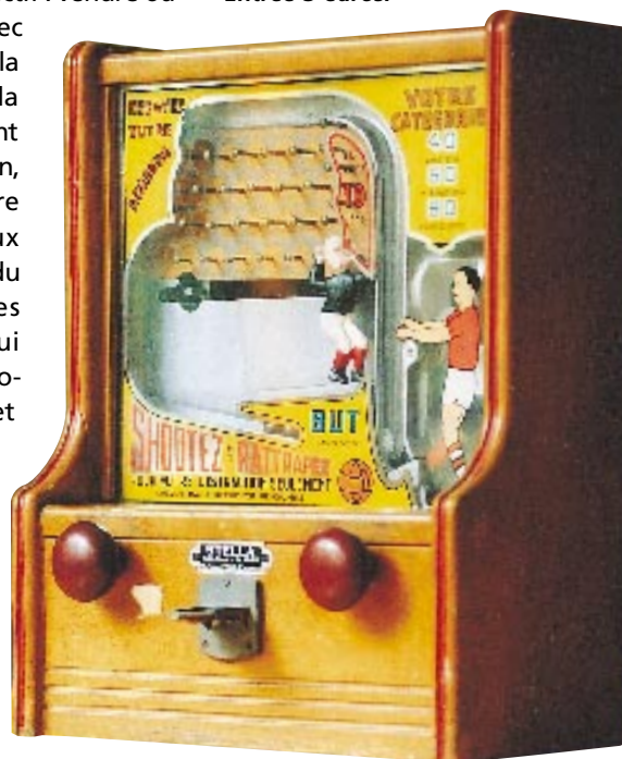
Ce jeu de comptoir, très prisé dans les années 30, est l'ancêtre du flipper.