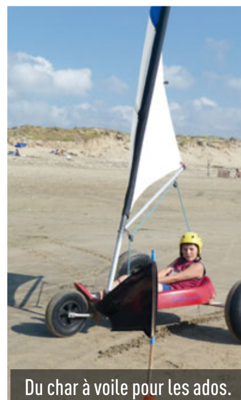
Du char à voile pour les ados.

➤ Maison de quartier, rue de la Tour-Chabot, 05 49 79 16 09.