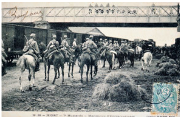
Collection Clouzot - Niort

➤ Expo du 20 sept. au 18 oct. Lectures les 20 et 21 sept. Plus d'info sur le site vivre-à-niort.com