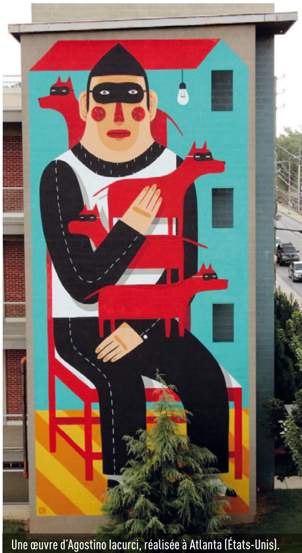
Une œuvre d'Agostino Iacurci, réalisée à Atlanta (États-Unis).

➤ Les lieux et les horaires du 4 e Mur à découvrir sur vivre-a-niort.com .