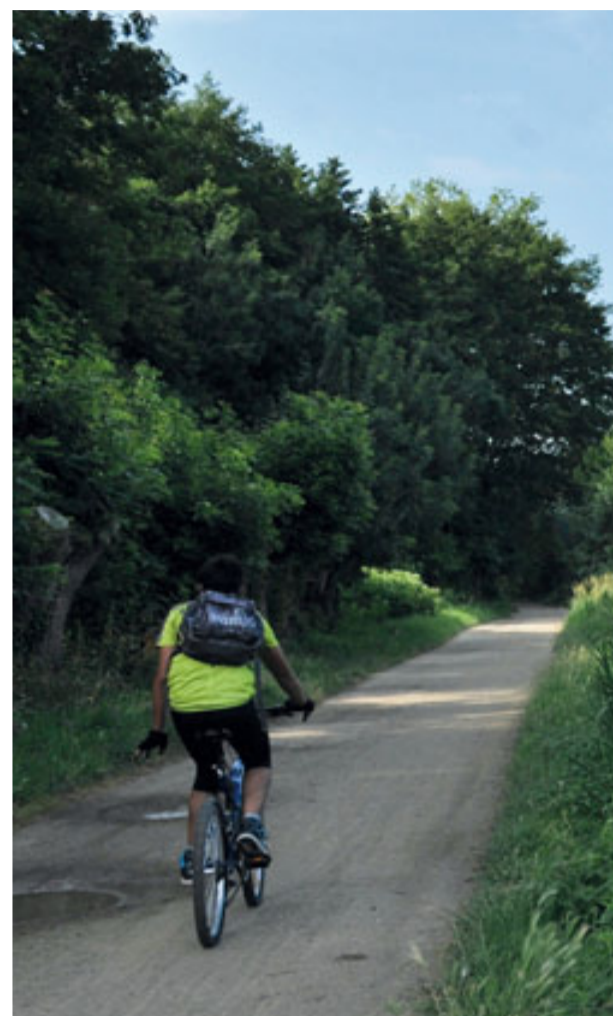
Parcourez les bords de Sèvre en vélo...

➤ Accueil : 2 rue Brisson, du lundi au samedi de 10h à 18h30, dimanches et jours fériés de 10h à 13h. N° indigo 0820 20 00 79 (appel 0,09 TTC/mn) site : www.niortmaraispoitevin.com ou niortmaraispoitevin.mobi