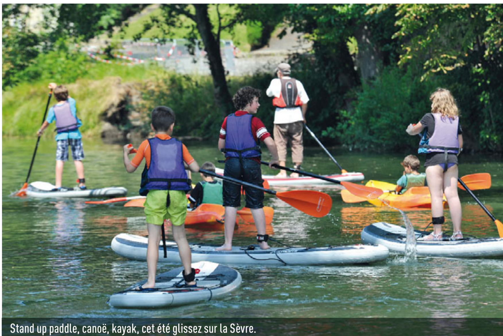
Stand up paddle, canoë, kayak, cet été glissez sur la Sèvre.

chaque mercredi de 17 à 18h. C'est aussi l'occasion de s'initier au stand up paddle (planche avec pagaie) du lundi au vendredi dans le même créneau horaire. Il est impératif de savoir nager et les formules "journée" doivent être réservées la veille avant 19h. Pensez aussi au plaisir rare qui vous est offert de vous initier à l'aviron (lire p.5). ■