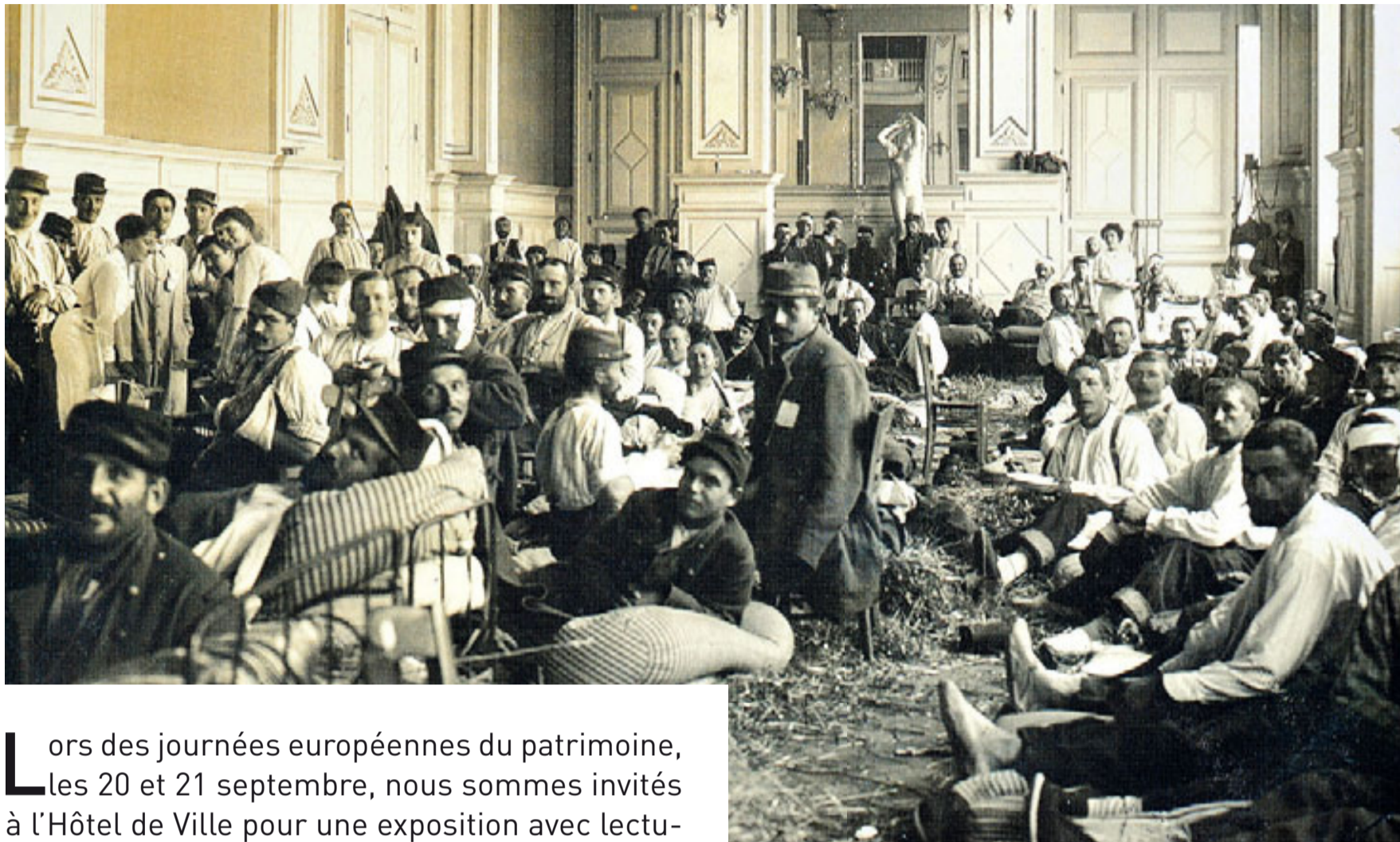
Archives départementales des Deux-Sèvres

Lors des journées européennes du patrimoine, les 20 et 21 septembre, nous sommes invités à l'Hôtel de Ville pour une exposition avec lectures, intitulée Niort, une ville hôpital de l'arrière . Le 3 août 1914, le Reich allemand déclarait la guerre à la France. Dès le 23 août, le premier convoi de blessés entrain en gare de Niort. "Les arrivées sont si nombreuses dès le premier mois, que les hôpitaux sont complets et qu'il faut, de toute urgence, envisager la création de nouveaux centres de soins", raconte André Texier dans son ouvrage Niort de 1914 à 1925 . Le 11 septembre, un convoi de 1200 blessés arrivait en gare. 750 d'entre eux étaient conduits à l'Hôtel de Ville, où ils restèrent six jours. La situation s'améliorait à partir de 1915, mais durant toute la guerre, notre ville accueillit de nombreux blessés. Le projet niortais, qui a reçu le label de la mission