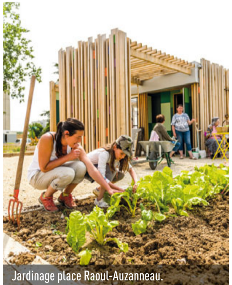
Jardinage place Raoul-Auzanneau.