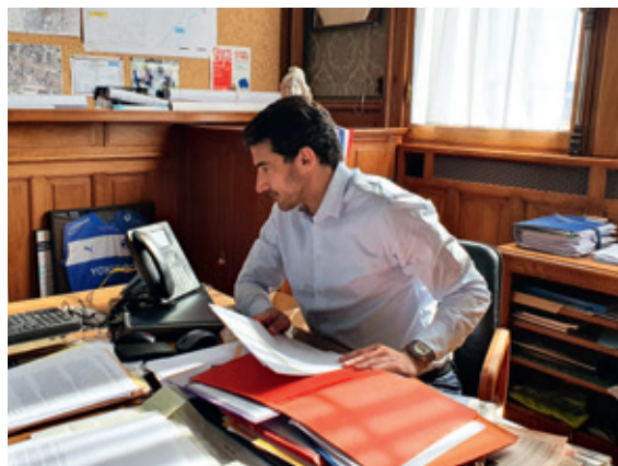
Ville de Niort

V oici plus d'un mois et demi qu'une crise sanitaire mondiale a transformé nos vies. Je sais combien ce confinement qui nous est imposé est difficile à vivre au quotidien et les sacrifices professionnels et familiaux qu'il implique.