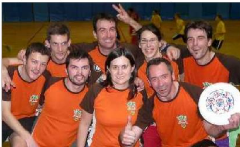
Champion de France indoor, le NUC va essayer de réaliser le même exploit en outdoor.

Entraînement : tous les jeudis soir, de 19 h à 21 h, au stade de Sainte-Pezenne. Renseignements au 06.12.95.34.40.