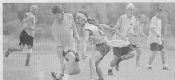
L'ultimate se pratique sur un terrain de 100 mètres de long sur 37 mètres de large, à peu près la taille d'un terrain de football (100 mètres de long pour 65 mètres de large).

limites du terrain. Un point est marqué quand le disque est attrapé avec succès par un joueur à l'intérieur de la zone d'en-but adverse. Le point n'est valable que si c'est un joueur de l'équipe offensive qui a lancé le disque. Le gagnant est l'équipe ayant le plus haut score à la fin du match. Aucun contact physique n'est autorisé. Le joueur en possession du disque ne doit pas marcher mais il peut établir un pied pivot. Et peut jouer le frisbee dans n'importe quelle direction. Toute violation des règles, toute faute, doit être annoncée par les joueurs présents sur le terrain de jeu.