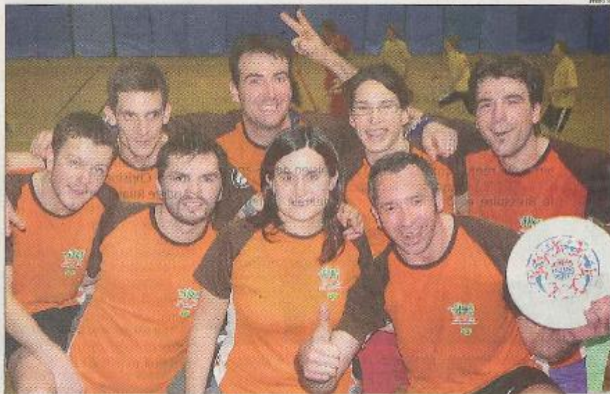
L'équipe championne de France accède à la troisième division

Avec l'arrivée du printemps, il entame désormais sa saison outdoor espérant réaliser sur herbe l'exploit similaire. Les prochains rendez-vous sont : les 26 et 27 avril pour la phase aller outdoor à Toulouse ; l'accueil à Niort de la phase retour les 31 mai et 1 er juin ; et pour