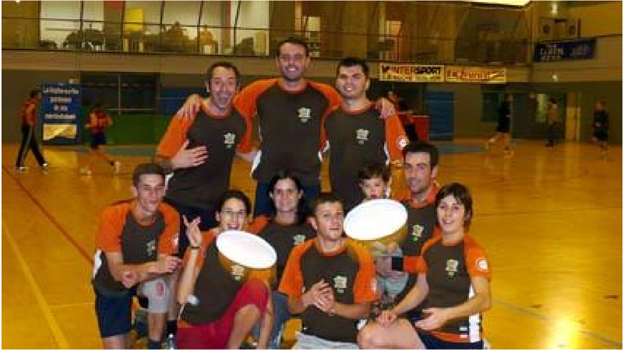
Le NUC - Janvier 2008