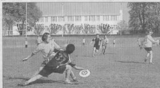
Particulièrement physique, l'ultimate se pratique sur un terrain rectangulaire de 100 mètres de long sur 37 mètres de large. On est ici très loin du frisbee de plage.

Opposant deux équipes de sept joueurs sur un terrain rectangulaire de 100 m de long sur 37 m de large, l'ultimate se pratique en auto-arbitrage, sans juge. « Cette philosophie repose évidemment sur le principe du fair-play. Un prix de fair-play est d'ailleurs décerné lors de chaque compétition à l'équipe ayant démontré le meilleur esprit de jeu. Par ailleurs, à la fin de chaque match, les deux équipes ont coutume de se ré-