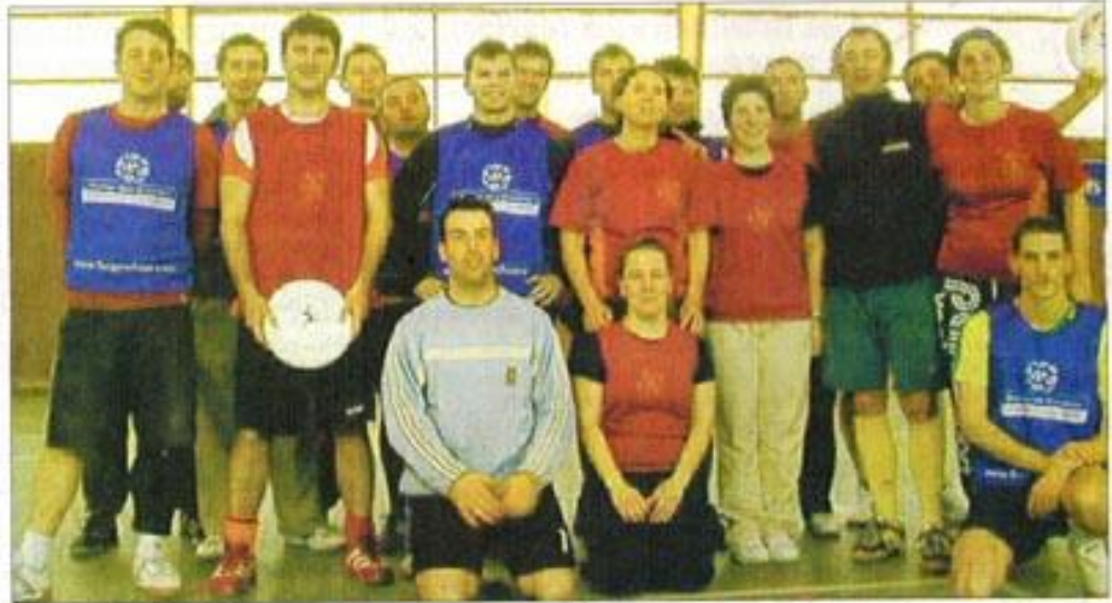
Les équipes du NUC et du RFO se sont affrontées dans une rencontre où le fair-play est de mise.

L'ultimate oppose deux équipes (de 5 joueurs en salle et de sept en extérieur) dont le but est de passer le frisbee à un partenaire présent dans la zone d'en-but. Sur le principe de l'attaque-défense et un peu à l'image du football américain, un match d'ultimate est fait de passes successives entre co-équipiers. Chaque joueur ou joueuse - car l'ultimate est le seul sport mixte qui se pratique sans arbitre - n'a que dix secondes pour passer le