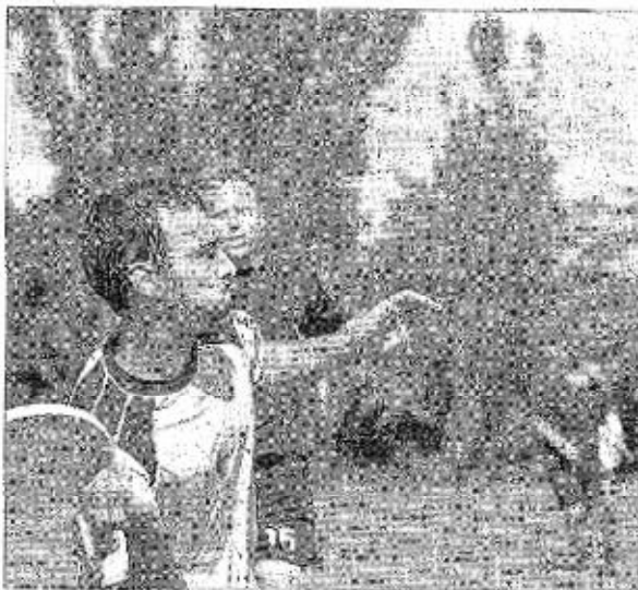
Fairplay et autoarbitrage, des valeurs chères aux champions de frisbee.