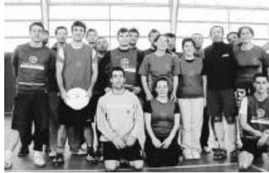
Le Niort ultimate club et Ré Flying Oysters (qui ne participait pas à l'expédition blésoise), lors d'une rencontre amicale cette année.

Le Niort Ultimate (*) Club, créé il y a juste un an, vient de disputer ses premiers matchs officiels à l'occasion de la phase aller du championnat indoor de Régionale, organisée à Blois par les Freezgoriphik. L'objectif du NUC était ambitieux : six équipes, cinq rencontres, cinq victoires. Mission presque accomplie. Les neuf Niortais se sont en effet montrés irrésistibles tout au long du week-end. Fier de porter le plus beau des maillots, le NUC ne lâcha rien du tout en mariant spectacle, mixité, sportivité et efficacité. Les joueurs reviennent triomphants, avec trois victoires et une défaite (résultats ci-dessous). Prochain rendez-vous : la phase retour les 24 et 25 février à La Roche-sur-Yon, pour tenter de se qualifier pour les play off et ainsi accéder à la Nationale 3. Oubliez le frisbee de votre adolescence, le NUC propose une discipline sportive de « haut niveau ».