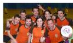
Le Nuc ses anges !!

↳ Consultez l'ensemble des résultats sur le site de la FFDE , rubrique [résultats]