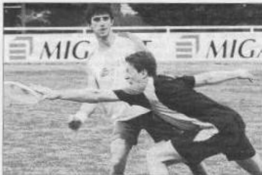
Un sport encore méconnu qui a pu se montrer à Espinassou.