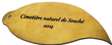
Feuille à graver au nom du défunt