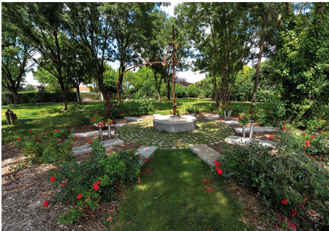
Jardin du souvenir