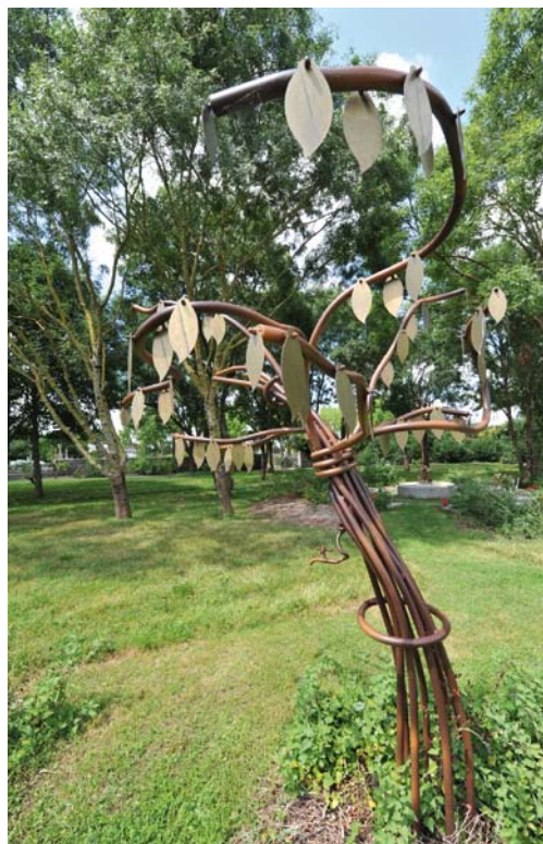
Arbre de printemps

Le jardin du souvenir offre la possibilité de procéder à la dispersion des cendres d'un défunt sans matérialisation de l'espace, si ce n'est par une feuille symbolique en laiton fournie par la Ville de Niort, gravée au nom du disparu et suspendue dans l'Arbre des Printemps. Ce geste, comme celui d'enfouir les cendres et de les recouvrir d'un broyat, peut être réalisé par un agent municipal ou par la famille si elle le souhaite. Seules des fleurs naturelles coupées peuvent être déposées dans des vases prévus à cet effet, aucun autre fleurissement ou objet funéraire n'est autorisé.