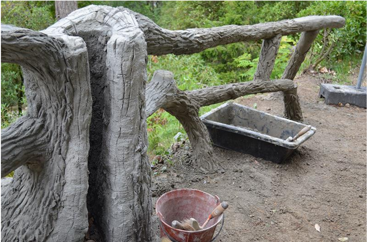
Les sculptures de rocaille du jardin des plantes – Bruno Derbord 2018