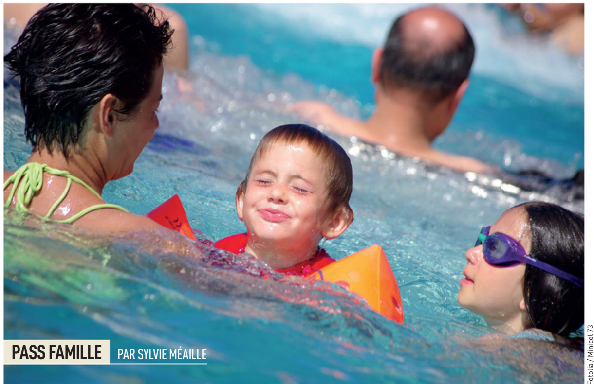
PASS FAMILLE PAR SYLVIE MÉAILLE

➤ Contact. UIA, Maison des associations, 12 rue Joseph-Cugnot. Tél. : 05 49 73 00 59 (répondeur). Courriel : uia.niort@orange.fr Internet : www.uia-niort.org