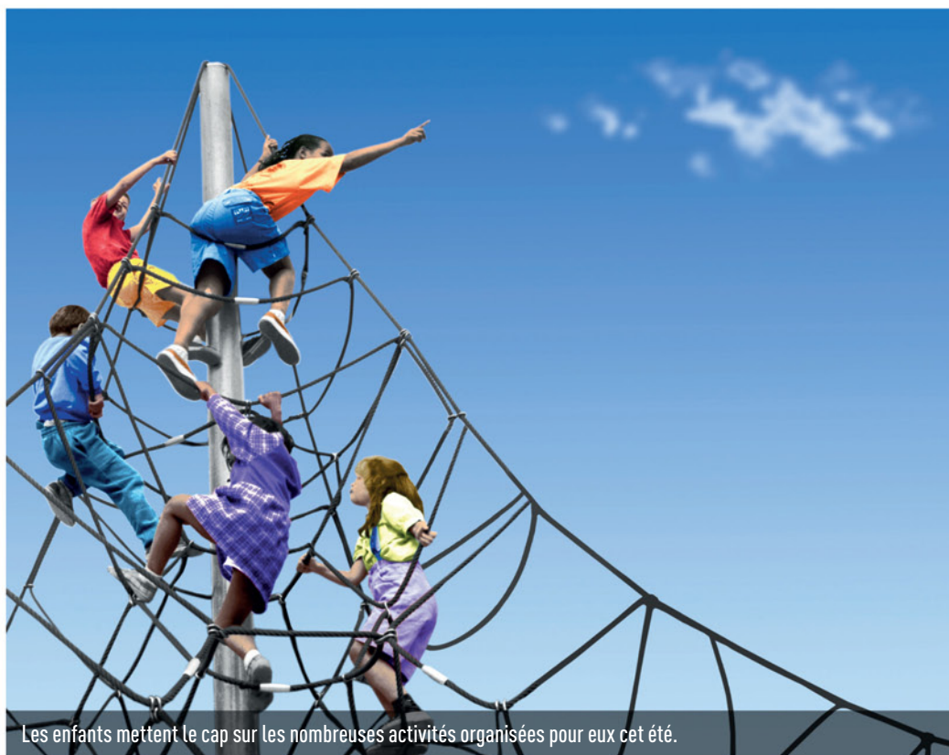
Les enfants mettent le cap sur les nombreuses activités organisées pour eux cet été.