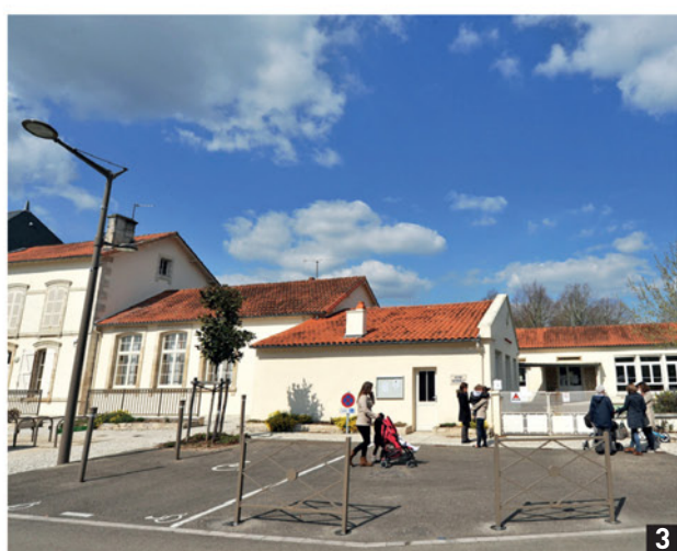
3 Bruno Derbord