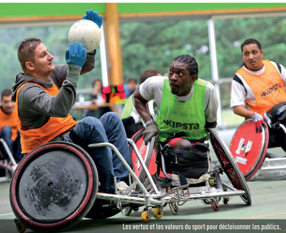
Les vertus et les valeurs du sport pour décroiser les publics.

Un questionnaire sur l'état de la pratique sportive à Niort par les personnes en situation de handicap sera mis en ligne pendant cette semaine sur le site de la Ville. ■