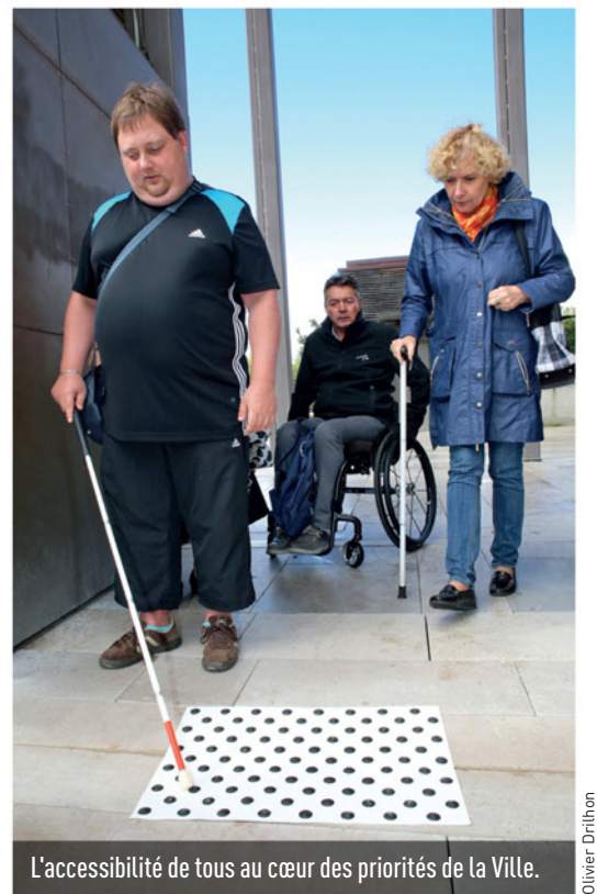
L'accessibilité de tous au cœur des priorités de la Ville.

En octobre 2013, le Conseil municipal avait adopté à l'unanimité la Charte Ville Handicap[s]. Depuis, la Ville s'engage aux côtés de partenaires institutionnels et associatifs pour faciliter la vie quotidienne des personnes handicapées. Elle soutient aujourd'hui le tout jeune Centre de ressources handicap, situé au Pôle universitaire de Niort, en l'accompagnant dans l'organisation de l'événement Accès libre conçu "pour mixer les publics" et sensibiliser le plus grand nombre aux enjeux "du bien vivre ensemble".