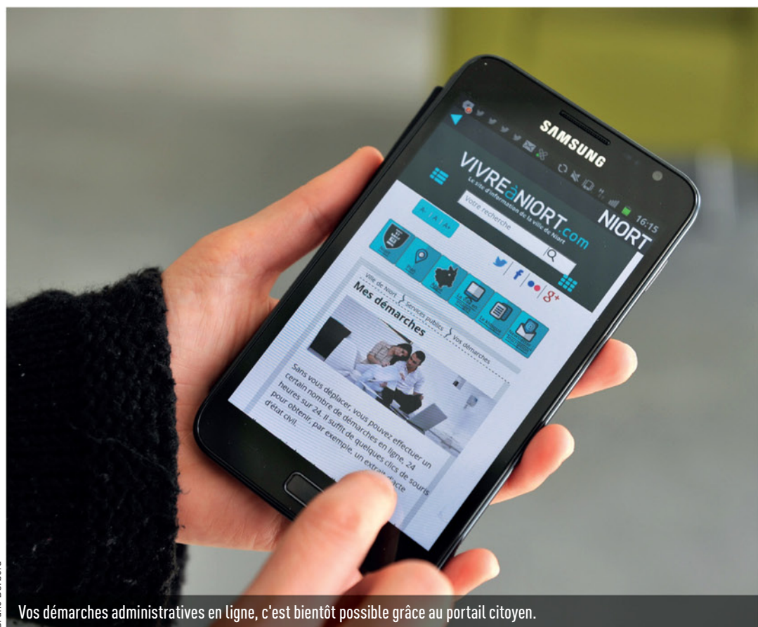
Vos démarches administratives en ligne, c'est bientôt possible grâce au portail citoyen.

Le projet dépasse les simples formalités administratives. En fin d'année, le site web facilitera les échanges avec les habitants qui pourront très simplement suivre le traitement de leurs demandes ou questions, en se connectant. Chacun pourra aussi signaler aux services municipaux des anomalies géolocalisées sur le domaine public, un trou dans la chaussée, un lampadaire cassé, un arbre dangereux, un dépôt sauvage de déchets... depuis leur ordinateur ou leur smartphone. Ce nouvel outil va aussi aider la Ville à renforcer le dialogue avec les citoyens en lançant des enquêtes sur tous types de projets en lien ou non avec l'activité des conseils de quartiers, ou des débats sous forme de forum. Au printemps prochain, la Ville permettra également aux familles de préinscrire en ligne leurs enfants à l'école. Elles auront la possibilité d'ouvrir un coffre-fort numérique pour y déposer les documents administratifs nécessaires à cette démarche et à bien d'autres portées par la direction de l'Éducation, comme les inscriptions en centres de loisirs. ■