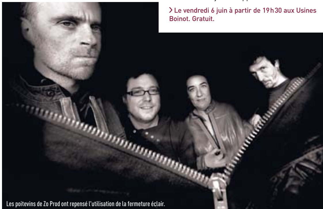
Les poitevins de Zo Prod ont repensé l'utilisation de la fermeture éclair.

➤ Le vendredi 6 juin à partir de 19h30 aux Usines Boinot. Gratuit.