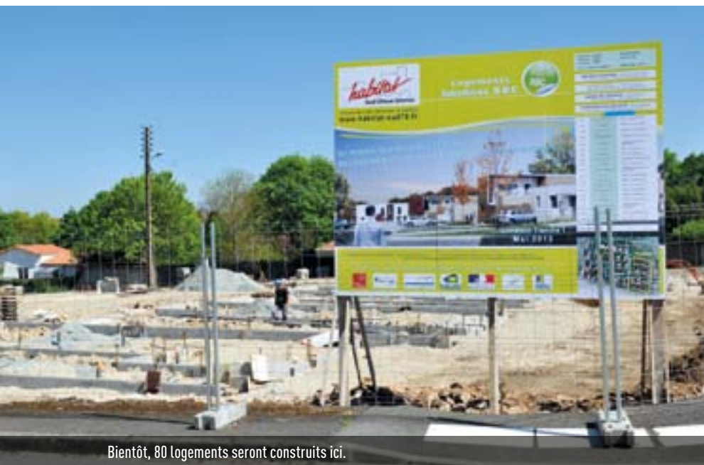
Bientôt, 80 logements seront construits ici.