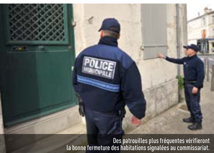
Des patrouilles plus fréquentes vérifieront la bonne fermeture des habitations signalées au commissariat.

> Inscrivez-vous au commissariat central, 2 rue de la Préfecture. Tél. 05 49 28 72 00.