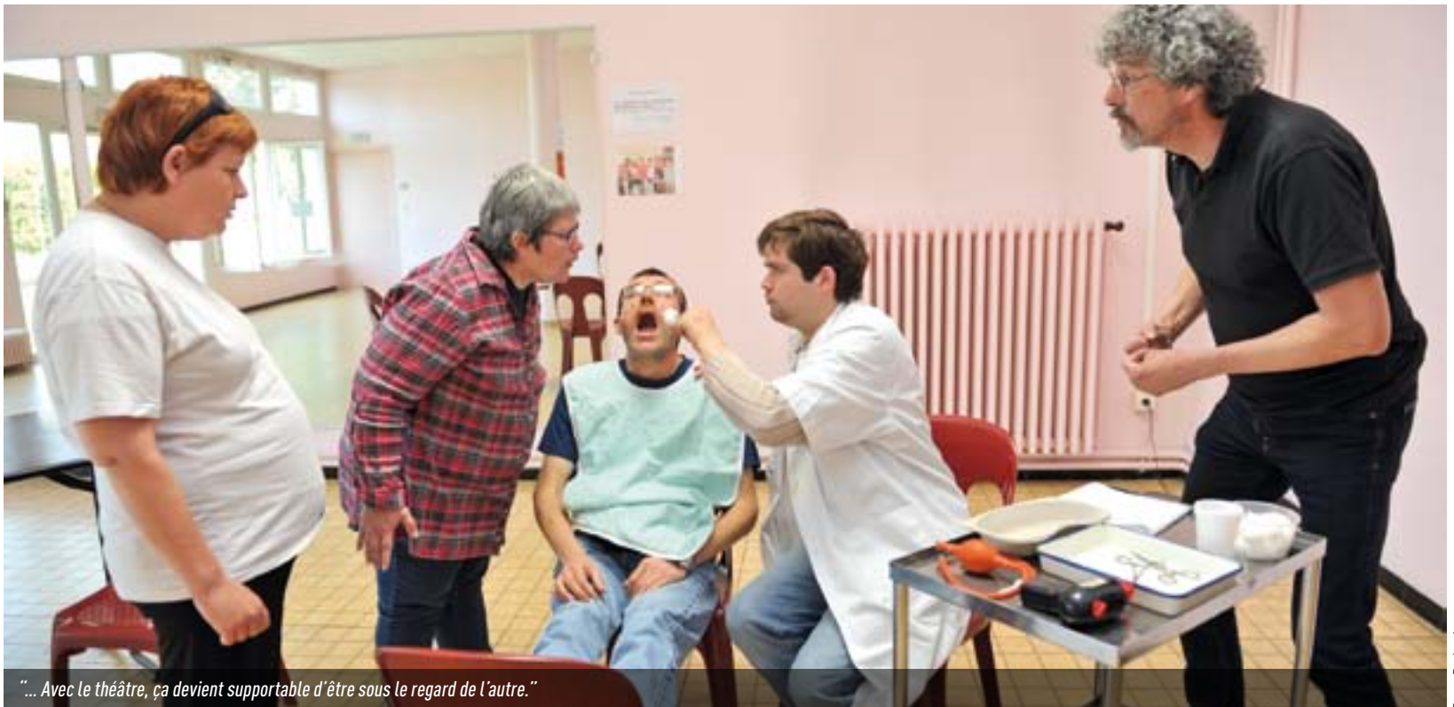
"... Avec le théâtre, ça devient supportable d'être sous le regard de l'autre."

À L'ATELIER THÉÂTRE, DES PATIENTS DE L'HÔPITAL PSYCHIATRIQUE OSENT ALLER À LA RENCONTRE DE L'AUTRE. AU PROGRAMME CETTE ANNÉE, UNE PIÈCE DE FEYDEAU, À VOIR AU PATRONAGE LAÏQUE.