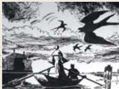
École d'arts plastiques (travaux d'ados)