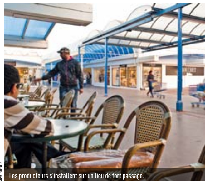
Les producteurs s'installent sur un lieu de fort passage.