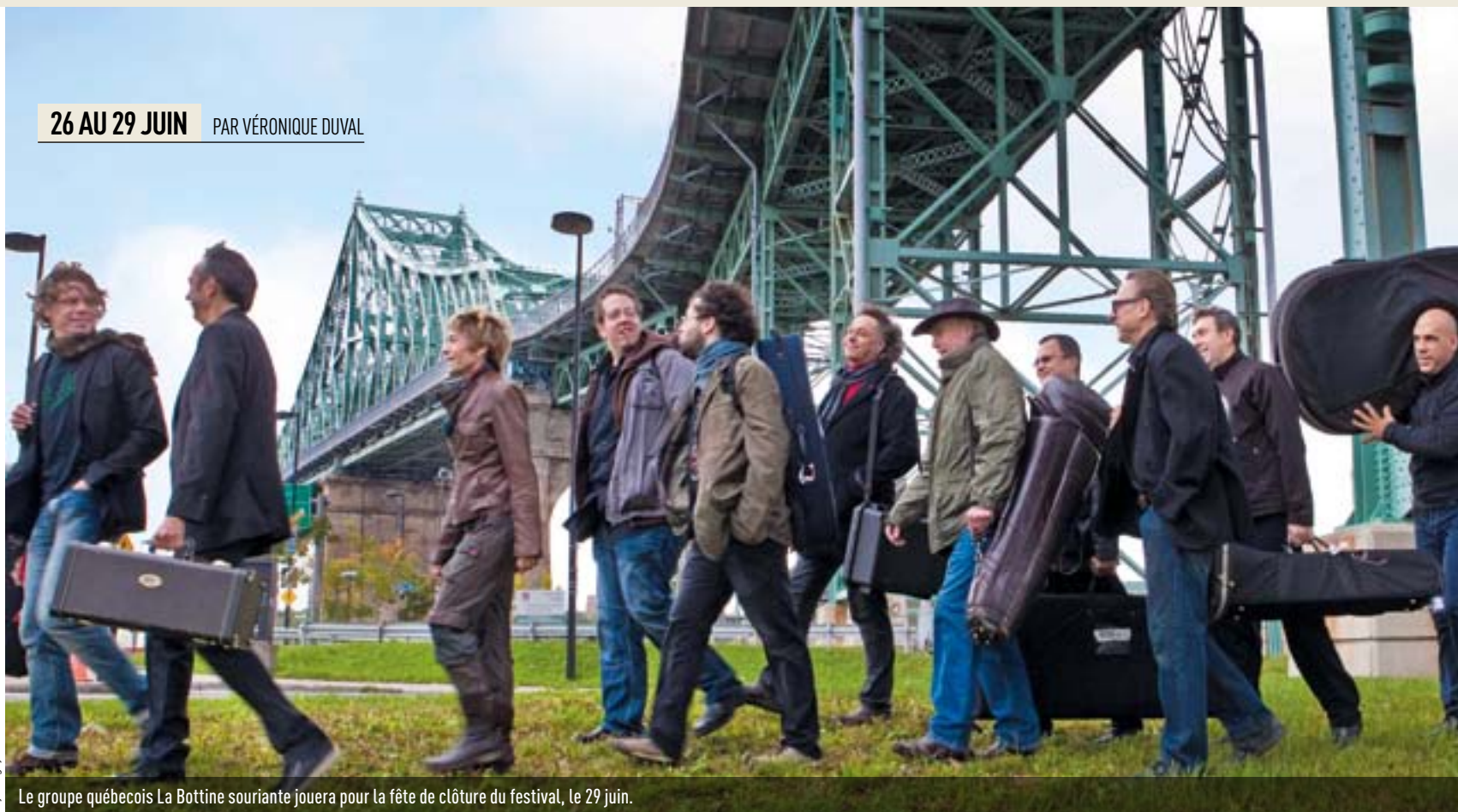
Le groupe québécois La Bottine souriante jouera pour la fête de clôture du festival, le 29 juin.