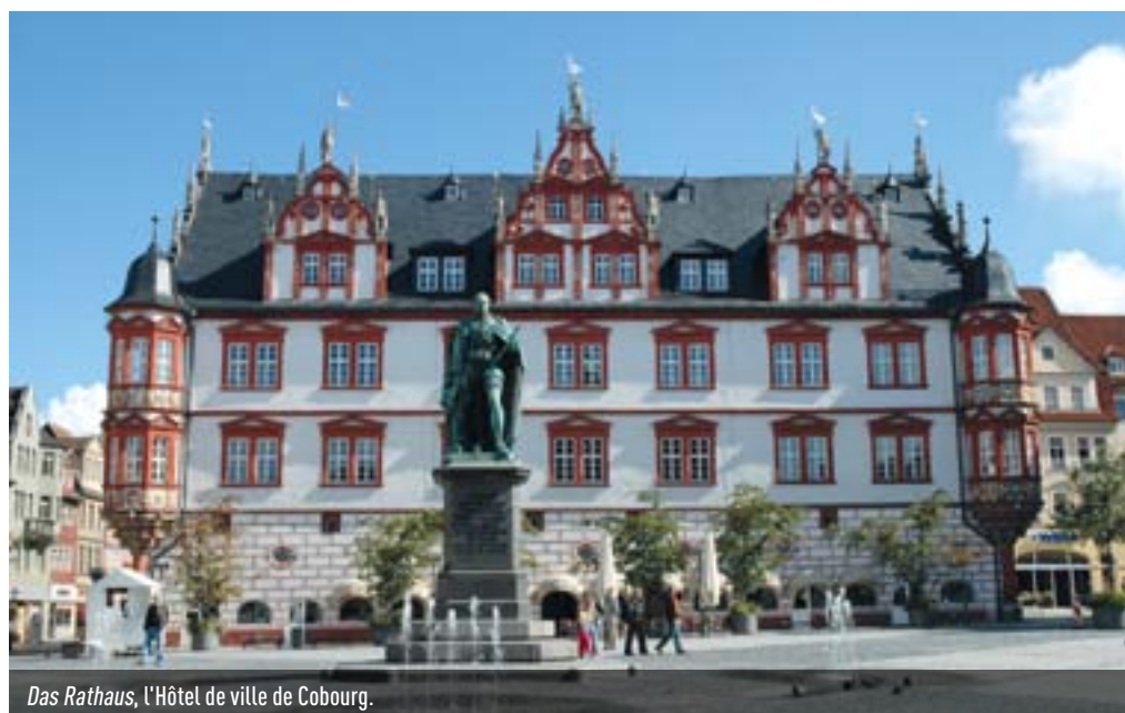
Das Rathaus, l'Hôtel de ville de Cobourg.

Loin de se résumer à des voyages vers l'une et l'autre ville, il se traduit en échanges culturels, linguistiques, pédagogiques, sociaux. Les jumeaux cobourgeois arriveront samedi 14 juin et enchaîneront