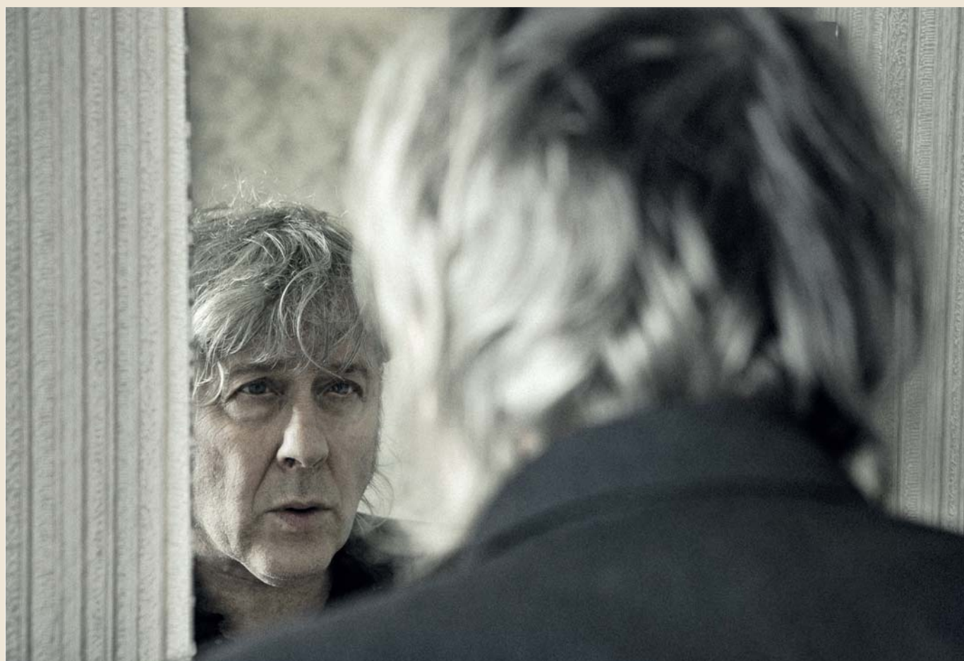
Arno et son 11 e album, à Niort le 6 avril.