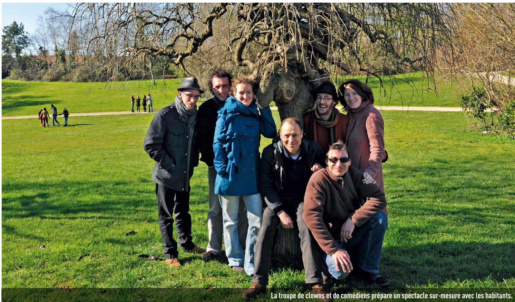
La troupe de clowns et de comédiens prépare un spectacle sur-mesure avec les habitants.

EXEMPLAIRE À PLUS D'UN TITRE, LE QUARTIER DES BRIZEAUX NOUS INVITE À FAIRE LA FÊTE AU CŒUR DE SON "POUMON VERT".