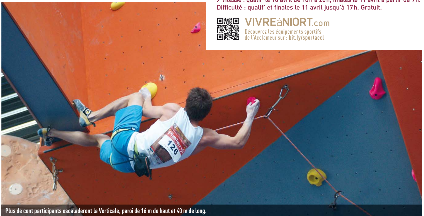
Plus de cent participants escaladeront la Verticale, paroi de 16 m de haut et 40 m de long.

Découvrez les équipements sportifs de l'Acclameur sur : bit.ly/sportaccl