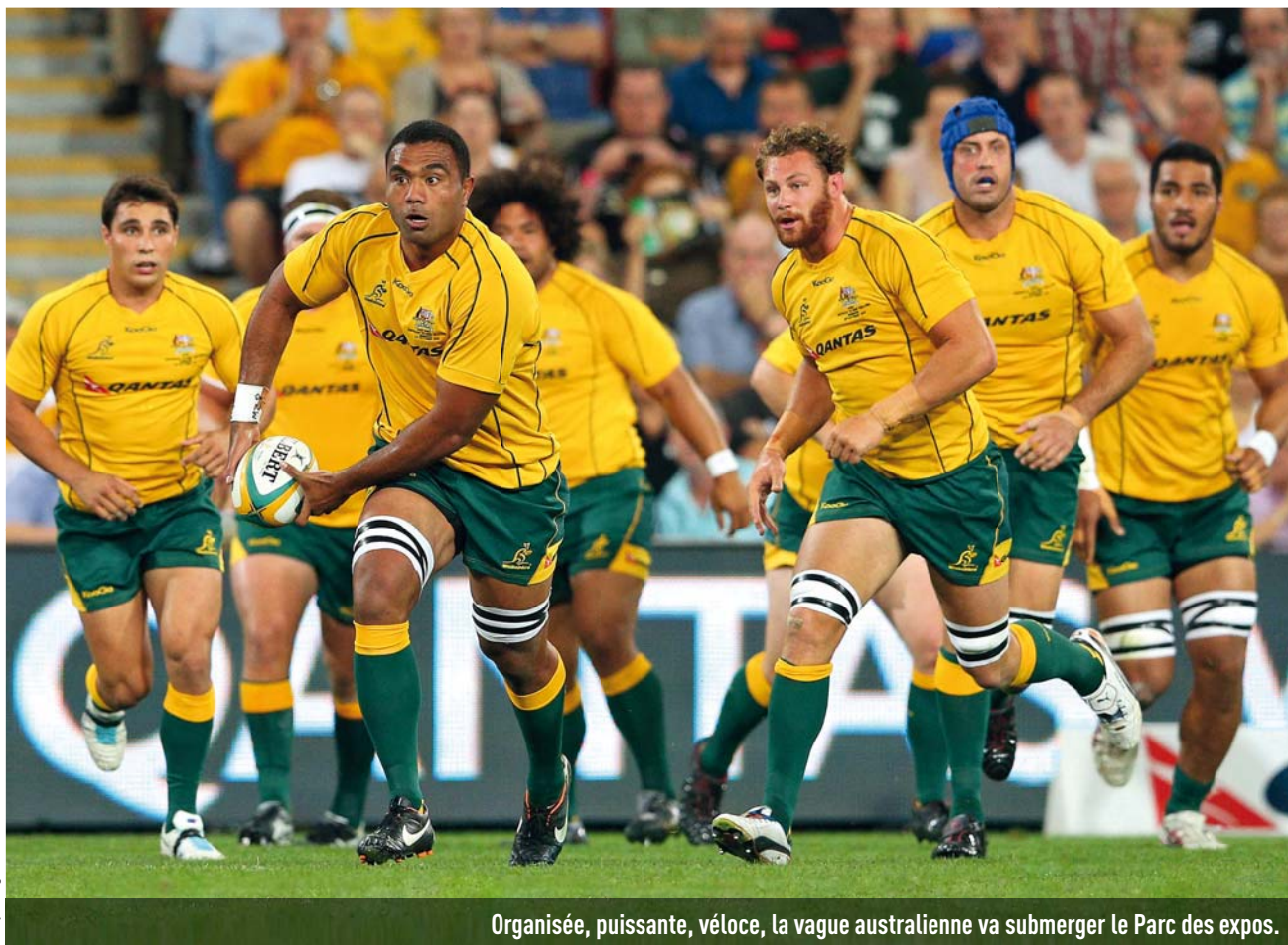
Organisée, puissante, véloce, la vague australienne va submerger le Parc des expos.