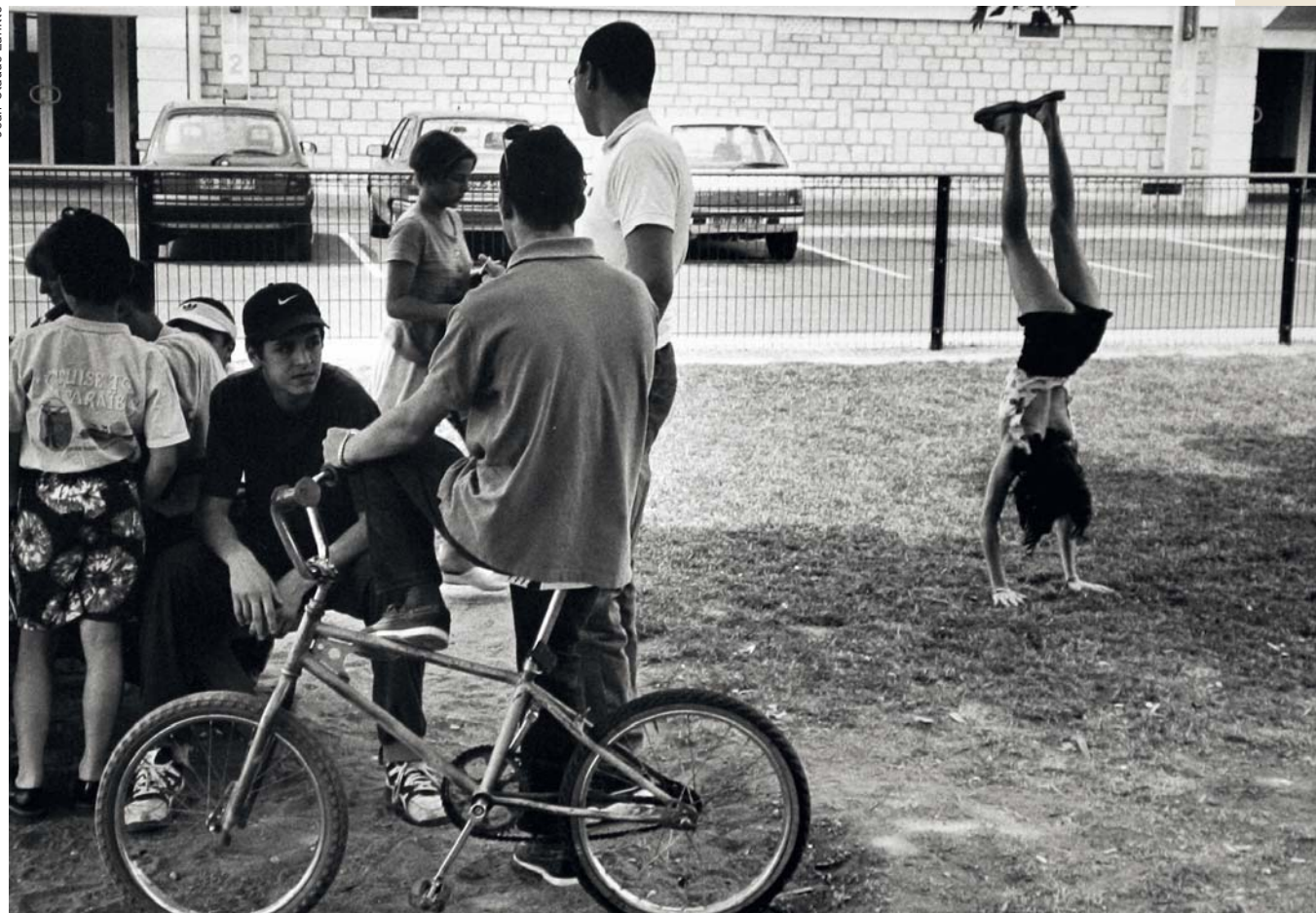
1997. Au centre de loisirs de Champclairot-Champommier, vu par Jean-Claude Laffitte.