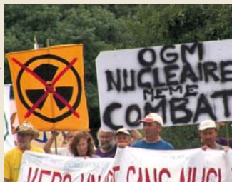
Extrait du film Tous cobayés

Tout sur la semaine du développement durable dans cette édition. P.4