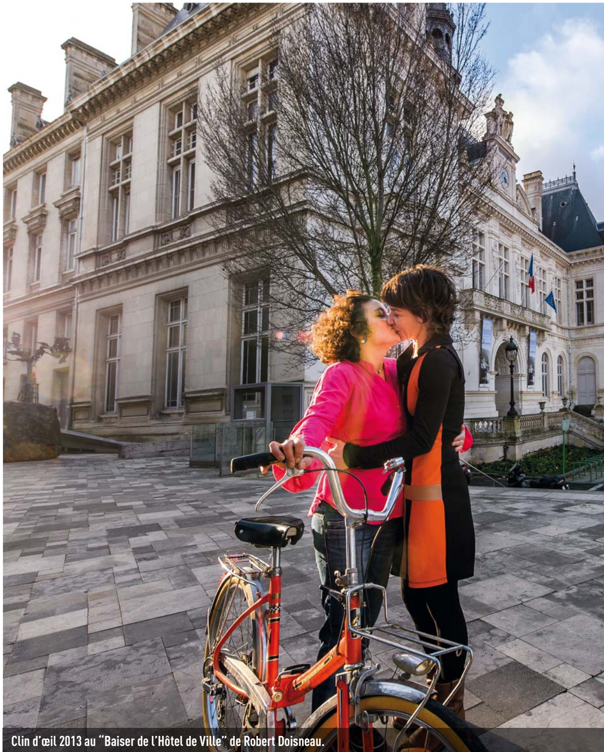
Clin d'œil 2013 au "Baiser de l'Hôtel de Ville" de Robert Doisneau.