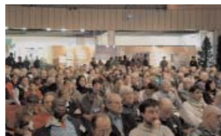
700 personnes ont assisté aux forums du samedi matin