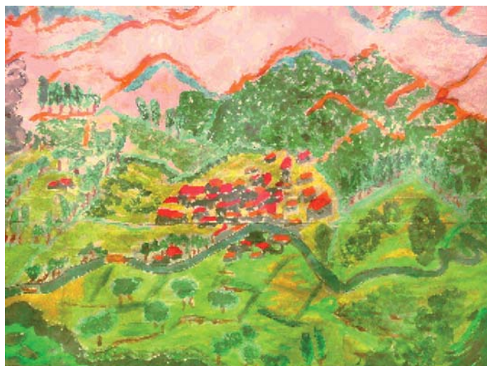
" Quartier d'ici et d'ailleurs " Peinture réalisée par les élèves de l'école élémentaire Jean Mermoz (Souché)