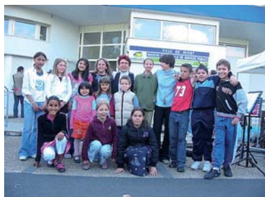
Les enfants de l'école primaire Jean Zay ont animé la soirée sur des airs de flûte. Les voisins se sont rassemblés autour d'une grande table devant la mairie de quartier.

La fête des voisins au Clou Bouchet est devenue incontournable. Chaque année au mois de mai, des habitants du Clou Bouchet se retrouvent aux pieds des immeubles pour partager un moment convivial autour d'un verre. Cette 4 ème édition a été marquée par les clowneries de Cirque en Scène qui ont ravi les enfants et amusé les parents.