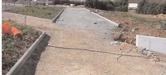
L'allée principale assurant la jonction depuis le parking jusqu'à la Maison de quartier en travaux