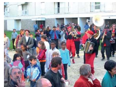
La déambulation de Cirque en scène aux pieds des immeubles Thimonnier s'est terminée par un spectacle clownesque à la mairie de quartier, pour le plus grand plaisir des enfants.