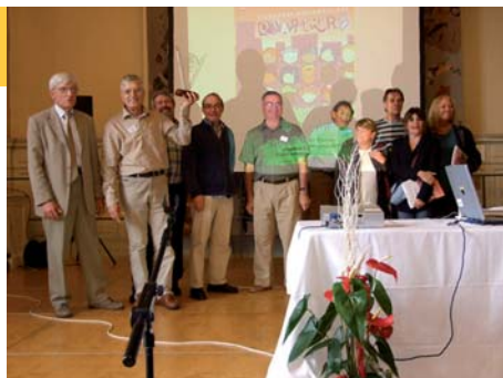
Les conseillers de quartier de Saint Florent connaissent bien les autres quartiers : ils remportent le trophée !

Cette année, le traditionnel trophée interquartiers ne s'est joué ni sur un terrain de football, ni sur un terrain de boule. C'est au jeu de la photo mystère que chaque quartier a pu s'illustrer. Et à ce jeu là, les conseillers de quartier de Saint Florent ont été les plus habiles, talonnés par ceux de la Tour Chabot Gavacherie, lesquels ont néanmoins chèrement défendu leur titre