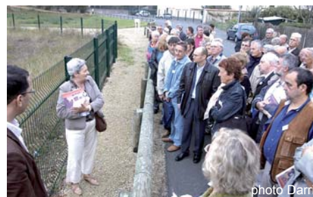
Le coteau Tartifume : un ensemble paysager auquel il convient de redonner une unité.

Le conseil de quartier a participé sur son budget à l'étude technique de valorisation du site à hauteur de 30 000 €.