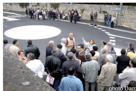
Un giratoire tout neuf au carrefour Aéroport/Sableau

Afin de ne pas trop perturber la circulation dans le secteur, les travaux ont été réalisés pendant les vacances scolaires, entre le 27 juin et le 4 septembre 2007.