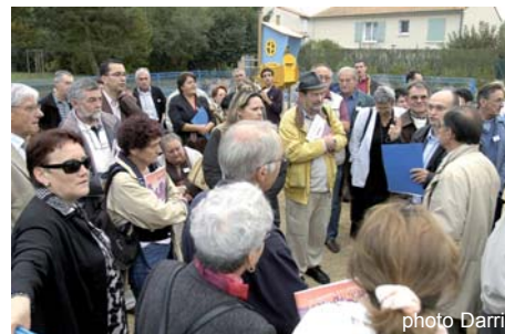
La présentation de l'aire de jeux du Grand Feu par les co-présidents du quartier de Sainte Pezenne

Pour la deuxième phase du projet, l'ouverture du bassin d'orage au public et sa valorisation, avec l'implantation d'un ponton, le conseil de quartier participe sur son budget à hauteur de 50 000 €. Les travaux sont envisagés en fin d'année 2007/ début d'année 2008.