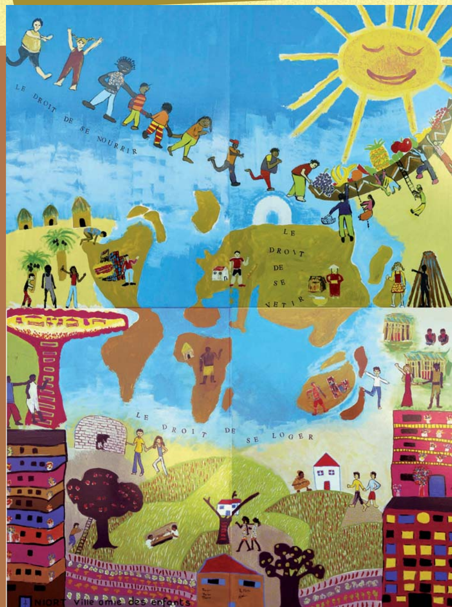
Droit de s'alimenter et d'être à l'abri (Dimensions : 3 x 4 m)