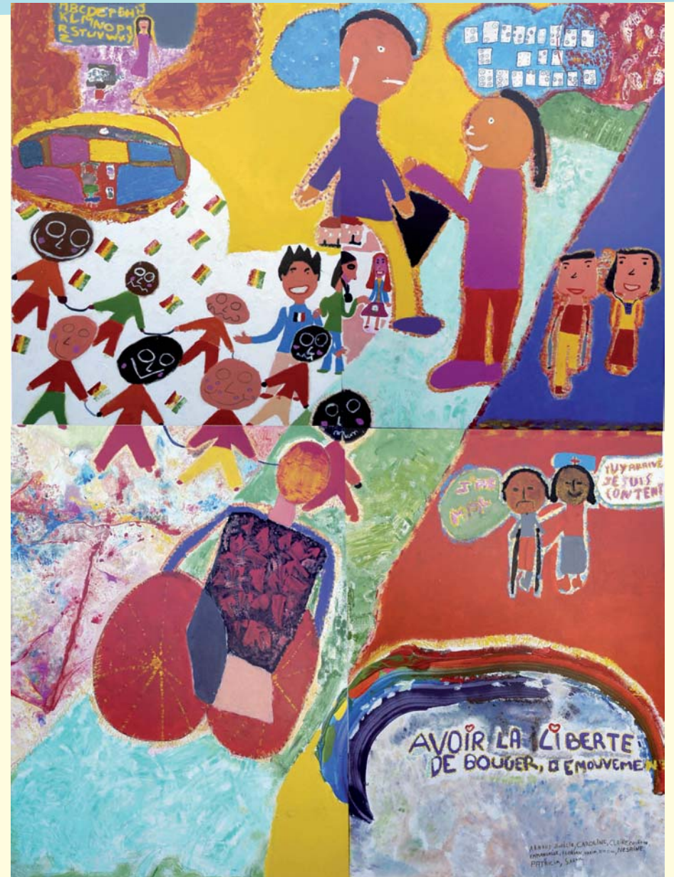
Droit des enfants handicapés (Dimensions : 3 x 4 m)

Après, la magie et le regard de ceux qui poseront leur yeux pour regarder et non plus pour voir...fera le reste...pour que de la fresque puisse naître la transmission du message.