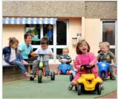
Multi accueil Mélodie

1 bis - 3 bis rue Jacques Daguerre - 79000 NIORT Tél. : 05 49 77 24 50