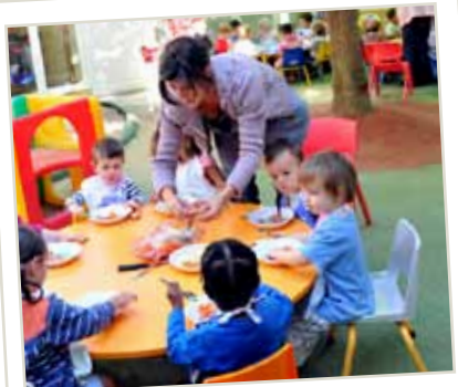
Multiaccueil du Mûrier