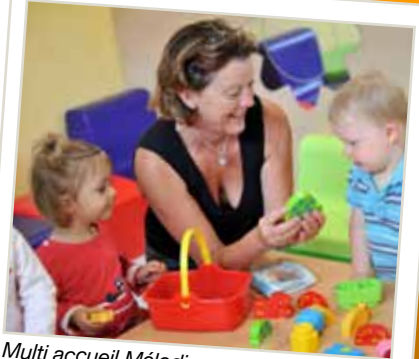
Multi accueil Mélodie